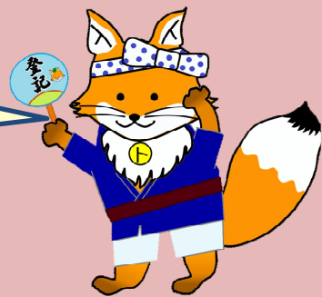
不動産登記推進イメージキャラクター 「トウキツネ」徳島・阿波バージョン